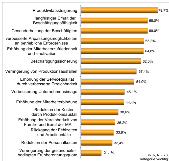
Abb. 1: Ziele einer Arbeitszeitveränderung

Auf die Frage, welche Ziele für ihr Unternehmen wichtig sind, wenn sie ihre Arbeitszeitregelungen verändern wollen, wurde von den befragten Unternehmern, Personalverantwortlichen und Führungskräften eine große Bandbreite von Antworten gegeben (Abb. 1).