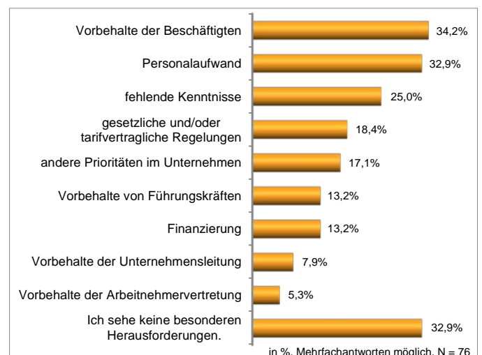
Abb. 3: Herausforderungen

Dabei stehen einer Veränderung verschiedene Herausforderungen im Weg (Abb. 3). Während zwar gut ein Drittel der Befragten angibt, keine besonderen Herausforderungen bei einer Veränderung zu sehen, geben die anderen vor allem Vorbehalte der Beschäftigten oder einen hohen Personalaufwand als mögliches Hemmnis an.